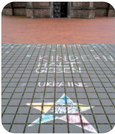
Sommige „Sternsinger“ schreven hun boodschap ook met krijt op de straat – of op het kerkplein

De actie „Sternsinger“ is iets bijzonders: elk jaar begin januari gaan in heel Duitsland kinderen in kleine groepjes van deur tot deur. Ze brengen Gods zegen voor het nieuwe jaar naar de mensen en schrijven die op de voordeur. In ruil daarvoor verzamelen ze giften voor kinderen over de hele wereld.