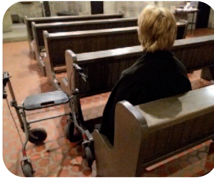
Als het gemeenschappelijke gebed niet meer mogelijk is ...