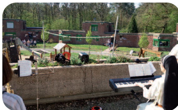
Samen zingen met Pasen 2020: niemand dacht nog aan hele openluchtgodsdiensten

Een gebied waarop wij zusters het coronaafstandsgebod vooral voelen is de liturgie. Het afgelopen jaar hebben we onze hygiëneconcepten in de parochies en kinderdorpen voortdurend aangepast aan de nieuwste bevindingen van de virologen en de richtlijnen van de politici.