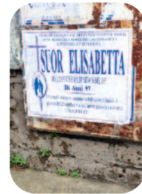
In Italië worden geen rouwkaarten verstuurd, maar worden op strategische plekken zg. „manifesten“ opgehangen

Een val op straat was het begin van het einde. In „De Passage“ in Grubbenvorst, overleed ze op 4 december: haar laatste afscheid!