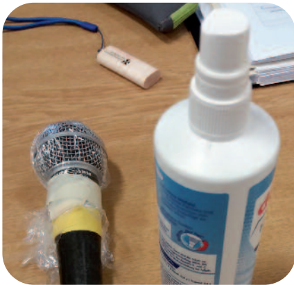
De sowieso ingepakte microfoon werd na elke interventie gedesinfecteerd

Van 1 t/m 4 dec hadden we ons algemeen kapittel, dat oorspronkelijk in april zou zijn. U begrijpt dat het een heel ander kapittel was dan er ooit is geweest. Het begon al met de bezinningsdag die via zoom werd georganiseerd. We hielden ons bezig met Pierre Claverie, een dominicaan die in 1996 in