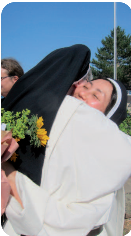
Een foto uit 2018: zo feliciteerden de zusters elkaar voor de pandemie

om afstand en nabijheid goed in balans te brengen. Jij mag jezelf zijn, in je relatie met God – en ik ook. Het is belangrijk dat we geen andere mensen gebruiken voor onze behoeften, dat is wat „kuisheid“ eigenlijk betekent.