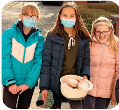
De „zoete verrassing“ bestond – zoals het seizoen al doet vermoeden – uit Berlijnse bollen.

Op 11 februari hielden de zusters in Waldniel hun „huisfeest“, d.w.z. de dag van de inwijding van het huis. 70 jaar geleden kwamen de bisschop en enkele vertegenwoordigers uit politiek en kerk om met de zusters de eerste steenlegging voor de bouw van een kinderdorp te vieren. Op dat moment werd niet alleen „Haus Clee“ gezegend (en omgedoopt tot klooster „Maria im Klee“), maar ook alle kinderen, jongeren en volwassenen die ooit op het terrein zouden komen wonen. Zij werden allen toen al onder de bescherming van Maria, de Moeder van God, geplaatst.