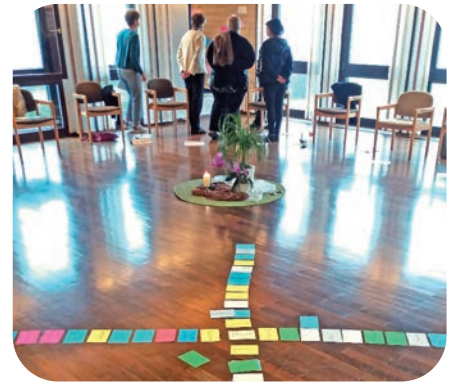
Tijdens de vergadering wordt het werk in kleine groepen afgewisseld met eenheden in plenum.

Ook al zijn velen zeer tevreden met waar zij zijn en met wat zij doen: wij zien noden waar niemand op reageert, wij dromen van andere vormen voor ons gemeenschappelijk leven, wij willen openbreken – ook onze eigen korsten.