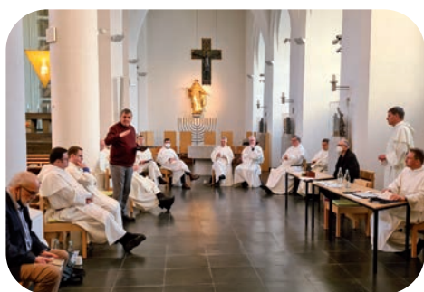
Het tweede deel van het Provinciaal Kapittel vond plaats in presentie. De kerk Heilig Kreuz in Keulen was er een waardige plaats voor – en passend voor corona.

De vele crises van onze tijd vormden de achtergrond voor de beraadslagingen van de kapittelbroeders, die een eigentijds antwoord zochten in de vier traditionele werkcommissies van Prediking, Vorming, Gemeenschapsleven en Bestuur, opdat de dominicanen geloofwaardige predikers blijven voor het volk en kritische tijdgenoten van de samenleving. Het „conclaaf“ heeft op 3 februari 2022 pater Peter Kreutzwald tot