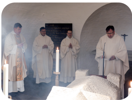
De nieuwe Provinciaal (links) en naast hem de Meester van de Orde in de crypte van St Andreas, bij het graf van St Albert.

Traditionele organisaties klaarmaken voor de toekomst is geen gemakkelijke taak. De dominicanen in Duitsland, Oostenrijk en Hongarije zijn deze uitdaging aangegaan. Tot nu toe behoorden ze tot de provincies Teutonia met het vicariaat Hongarije en de Zuid-Duits-Oostenrijkse provincie. Op 28 januari 2024 werden hun krachten gebundeld en een nieuwe provincie gesticht, de „Provincie Sint Albertus van de dominicanen in Duitsland en Oostenrijk“.