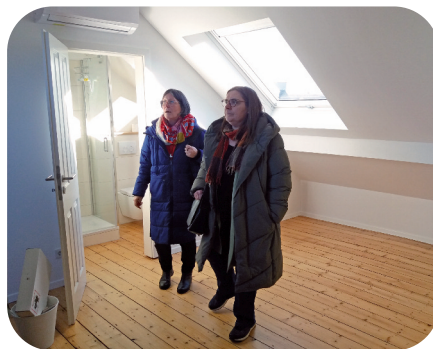
Tijdens de rondleiding door het huis.

Eindelijk is het zover: een jaar geleden besloot het Algemeen Kapittel een nieuw vormingsklooster te stichten. Tot nu toe was het noviciaat altijd in een van onze kinderdorpen. Natuurlijk blijven we op verschillende manieren nauw verbonden met de kinderdorpen, maar het dagelijks leven van de jongere zusters speelt zich steeds meer daarbuiten af. Nu beginnen we iets nieuws in een stedelijke omgeving.